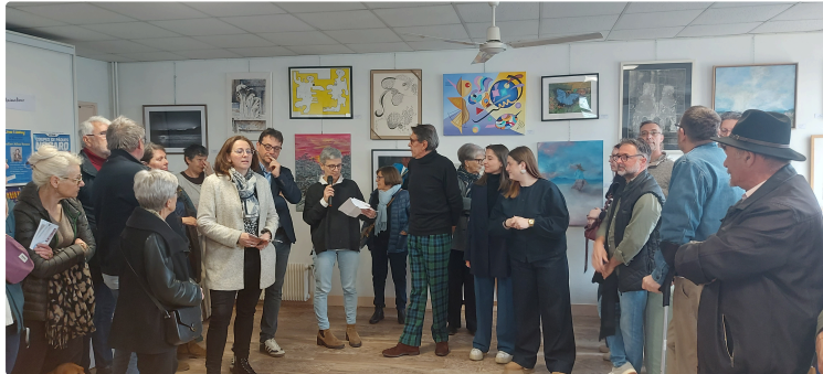
Un vernissage réussi pour le lancement du Printemps des Arts

Samedi matin, les locaux de l'Office de Tourisme Armagnac et d'Artagnan de Vic-Fezensac ont accueilli le vernissage de la 4e édition du Printemps des Arts.