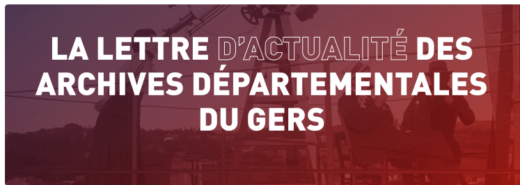
La lettre d'actualité des Archives départementales du Gers