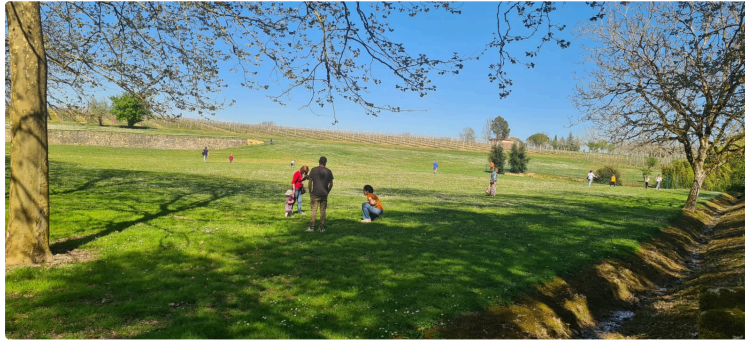
Une chasse aux oeufs réussie au château de Cassaigne

Le dimanche 5 avril, le parc du château de Cassaigne a accueilli sa première chasse aux œufs organisée par le Foyer de Cassaigne et le Château de Cassaigne.