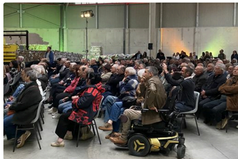
La salle affichait complet.