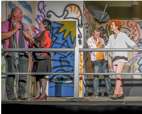
Scène de "La Pause"

« La Pause » est la 7ème production de la troupe. À voir pour se détendre !