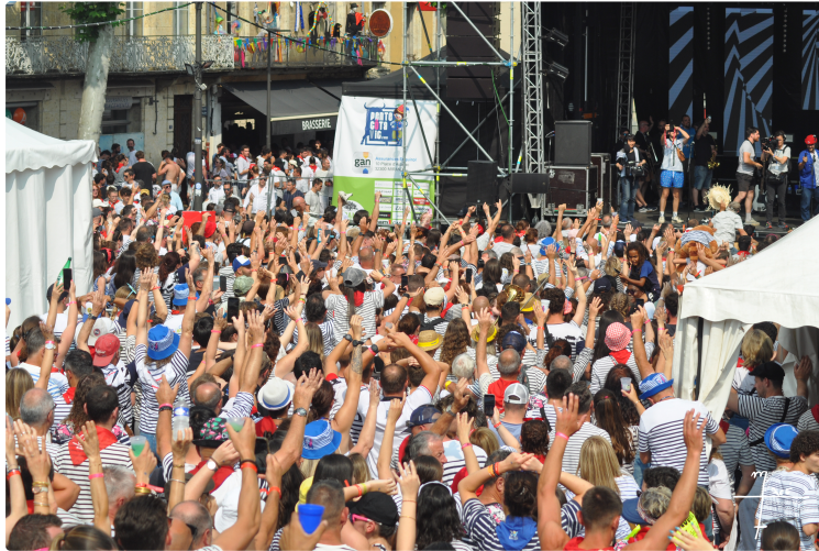
Pentecôtavic : toutes les informations pratiques !

Comme tous les ans, la mairie de Vic-Fezensac met tout en œuvre pour que le week-end des festivités de Pentecôtavic se déroule dans les meilleures conditions.