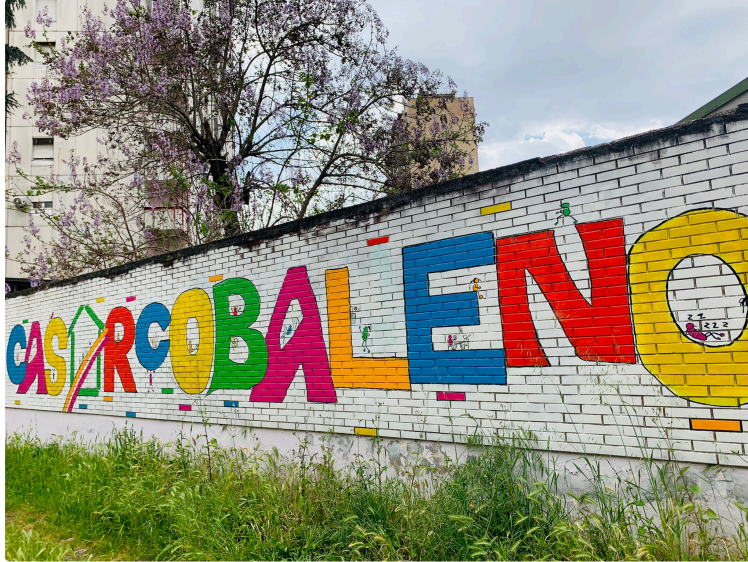
La Semaine au Campus Saint Christophe