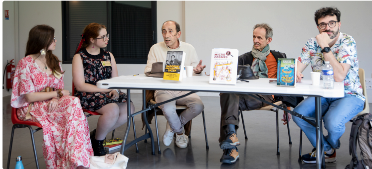
Les Rencontres et le Prix littéraires de Nogaro 22 et 23 mai 2026

Des tables rondes avec des écrivains, des rencontres en librairie et un salon du livre