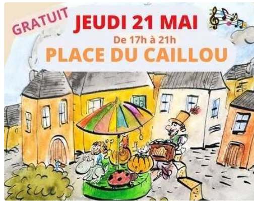
L'association Kiosk dévoile ses ambitions

Place du Caillou : des animations le 21 mai et le 13 juin sont programmées en attendant l'ouverture d'un nouveau local culturel