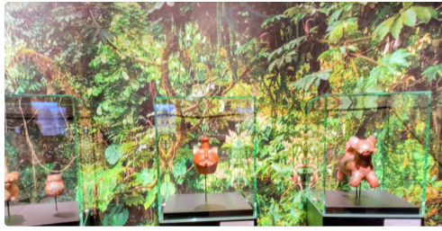
...poteries dans un climat amazonien