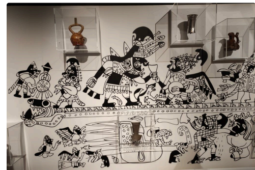
Plusieurs aspects de l'exposition...