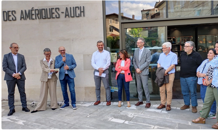
Le Musée des Amériques-Auch invite à l'exposition "Pérou précolombien : un regard sur le monde"

Une occasion de célébrer les liens inter-régionaux et faire découvrir l'héritage d'un monde perdu