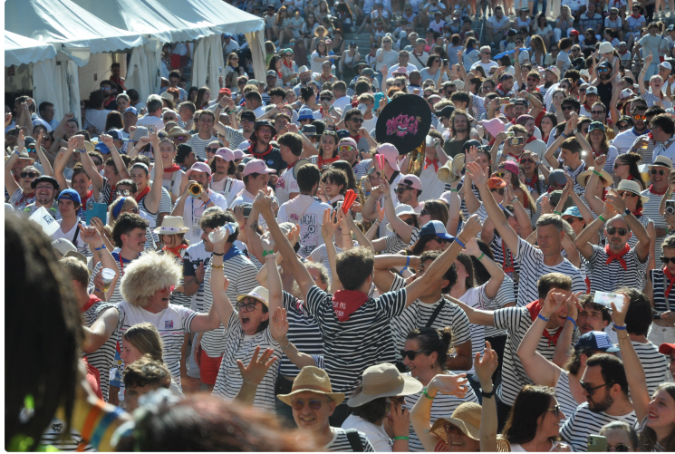
Pentecôtavic bat le record du monde de rassemblement de marinières

Il aura fallu trois années de ferveur populaire, de défis lancés et de marées bleu et blanc pour que Vic-Fezensac décroche enfin son graal.