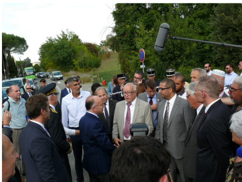
Le ministre à son arrivée salue les autorités religieuses.