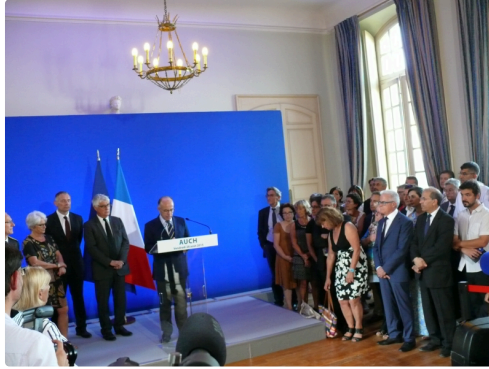
De nombreux élus ont assisté au discours du ministre de l'Intérieur.