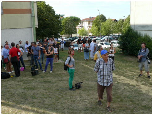
Journalistes, cameramans, photographes, à l'ombre d'une tour du Garros. Il faisait 33 degrés.