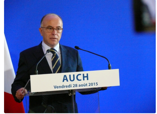
Bernard Cazeneuve: « La République, c'est la laïcité ».