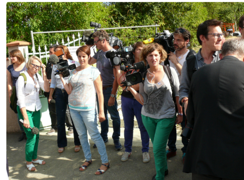
Les différents médias attendent l'arrivée éminente de Bernard Cazeneuve.