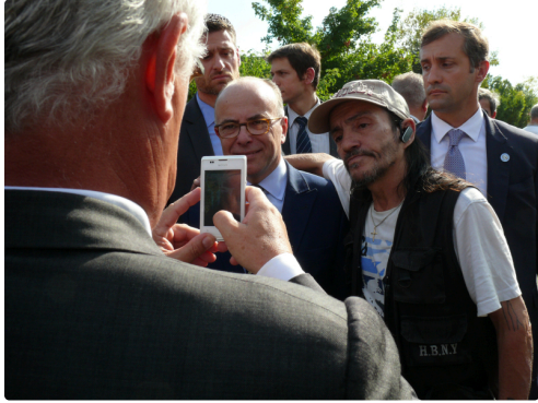
Le ministre.