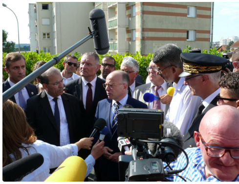
Le ministre répond aux questions des journalistes.