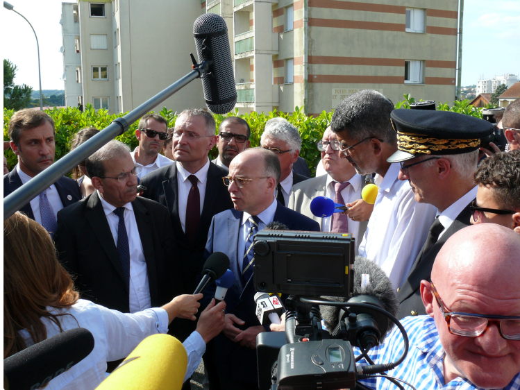
BERNARD CAZENEUVE RAPPELLE LES VALEURS DE LA LAÏCITÉ

Lors de la visite de la mosquée incendiée, le ministre a confirmé son soutien à la communauté musulmane