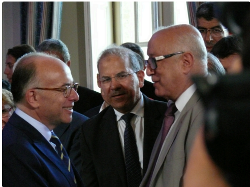
Le ministre s'entretient avec les autorités du culte musulman.