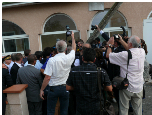
Difficile de se faire une place pour écouter ou photographier le ministre de l'Intérieur.