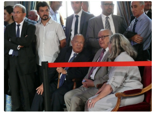
Le recteur de la grande mosquée de Paris, Dalil Boubakeur, était présent à la préfecture.