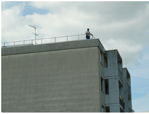
Au niveau sécurité pour la venue du ministre, rien n'a été laissé au hasard.