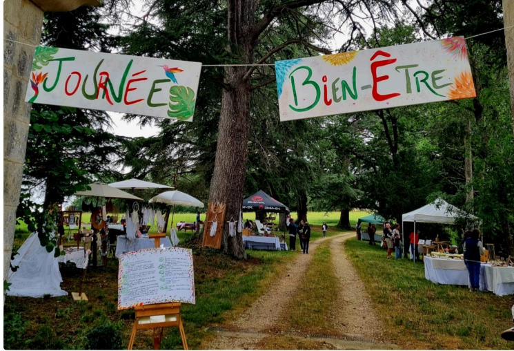
Journée bien-être et développement personnel au château de Rozès

Le village de Rozès accueillera, le dimanche 7 juin, la 6e édition de la Journée bien-être et développement personnel, organisée au château de Rozès de 10 heures à 18 heures.