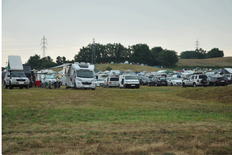
Tempo Latino 2026 du 30 juillet au 2 août : où dormir ?

Que vous veniez en tente, en van ou que vous cherchiez un lit douillet, plusieurs solutions s'offrent à vous pour loger à Vic-Fzensac pendant le festival.