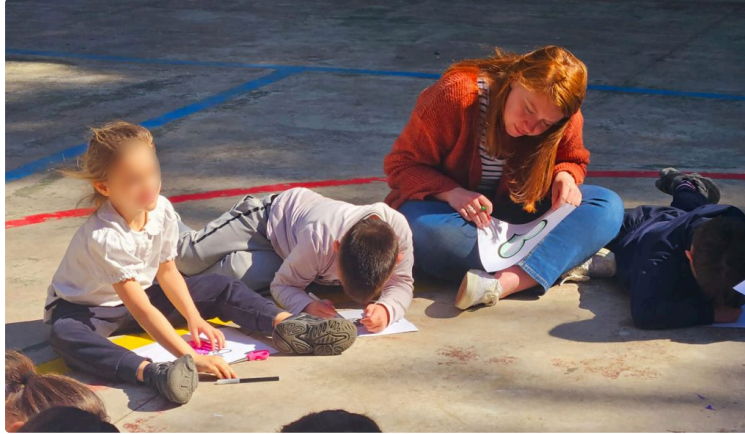
Scampia : quand le service devient rencontre

Participer au projet SEMIL et partir à Scampia, dans cette « école de la deuxième chance » qu'est CasArcobaleno, a profondément marqué chacun d'entre nous. Derrière ce voyage solidaire, il y avait des mois de préparation, mais surtout une envie commune : aller à la rencontre de l'autre, apprendre autrement et se mettre au service des plus démunis.