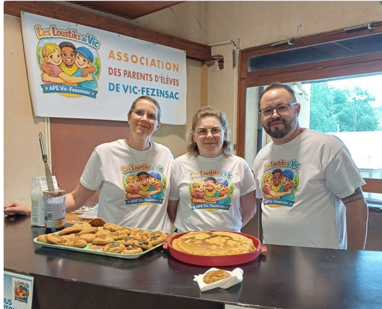
L'APE Les Loustiks de Vic multiplie les initiatives et lance un appel aux familles

Créée en janvier dernier, l'association de parents d'élèves les Loustiks de Vic n'a pas tardé à se mettre au travail pour soutenir les écoles maternelle et élémentaire de Vic-Fezensac. Portée par une équipe particulièrement investie, l'association enchaîne les actions tout au long de l'année scolaire afin de financer des projets pédagogiques et améliorer le quotidien des élèves.