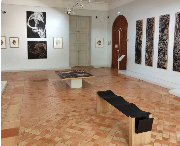
Dernière semaine pour venir profiter de l'exposition d'Iris Miranda !