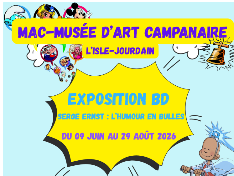
Serge ERNST : l'humour en bulles s'invite au musée d'Art Campanaire

Le Musée d'Art Campanaire de L'Isle-Jourdain accueille du 9 juin au 29 août 2026 une exposition exceptionnelle consacrée au dessinateur de bande dessinée Serge Ernst, figure incontournable de l'humour graphique.