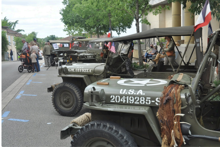
Le Jeep Club d'Artagnan attire les passionnés lors de la soirée de la Libération

Invité à participer à la soirée commémorative du 6 juin organisée au Hall des expositions d'Eauze, le Jeep Club d'Artagnan a largement contribué au succès de cette journée consacrée à la Libération.