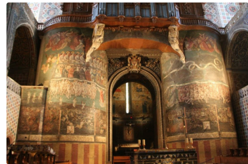
Le jugement dernier , monumentale fresque dans la cathédrale