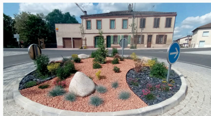
Nouvelles Lislolsiennes - n°50 - juin-août 2026

Ce projet a bénéficié de financements de l'État au titre de la DETR et du Conseil départemental du Gers, contribuant à la réalisation d'aménagements durables et qualitatifs en entrée de ville.