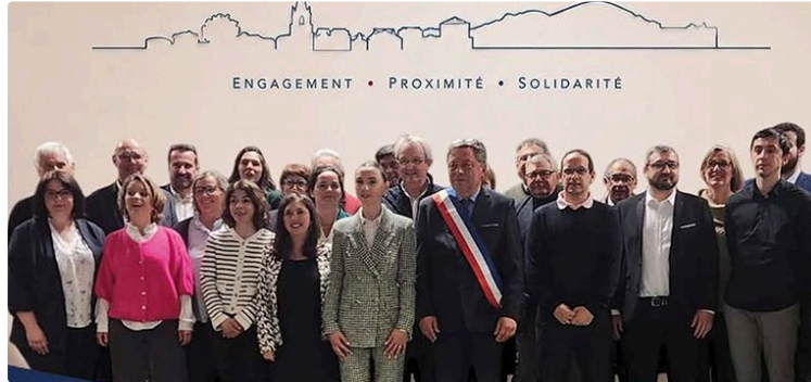
Le n°50 du magazine municipal