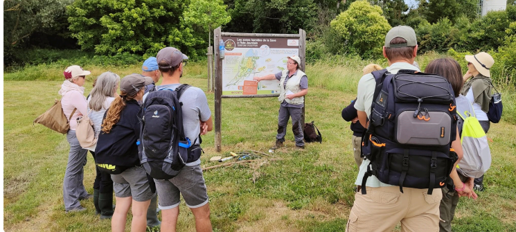
Immersion au cœur de la zone humide

Journée de l'écotourisme 2026 : immersion au cœur de la zone humide