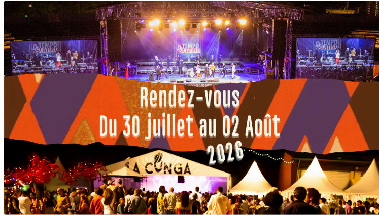
Tempo Latino 2026 : ouverture des inscriptions aux stages de danse 2026 !