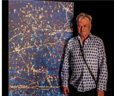
Exposition : Antoine Poupel – Photographies / Peindre la lumière