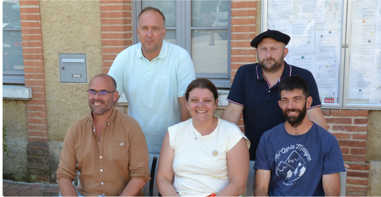
Soirées gourmandes 2026 : retrouver l'esprit d'antan