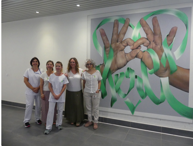
Journée nationale de réflexion sur le don d'organes : une fresque pour honorer les donateurs et sensibiliser le public

A l'occasion de la journée nationale de réflexion sur le don d'organes et la greffe, une fresque commémorative a été inaugurée le 22 juin au Centre hospitalier d'Auch, en hommage aux donateurs d'organes et à leurs proches. Cette œuvre s'inscrit dans la démarche recommandée par l' Agence de la Biomédecine visant à développer des lieux de mémoire permettant d'honorer le geste de générosité des donateurs et de sensibiliser le public à l'importance du don d'organes. Cette fresque témoignera de la solidarité qui rend possible la greffe et offre chaque année une nouvelle chance de vie à de nombreux patients.