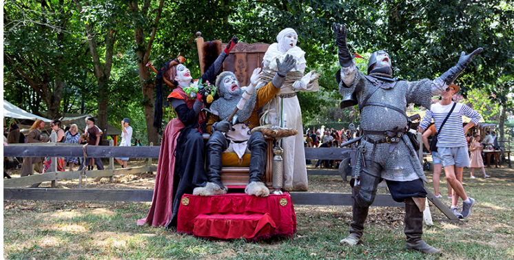
Festival médiéval de la Tour de Termes-d'Armagnac

Le festival médiéval de la Tour de Termes,