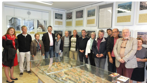
L'exposition sur les centres de peuplement au 20 Grande rue est une réalisation des Motivés.