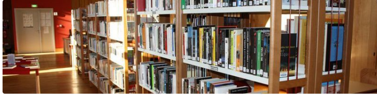
PAVIE La Médiathèque au c

Plus que jamais la culture est indispensable pour faire rempart à l'obscurantisme et l'intolérance. La riche collection de documents de la Médiathèque (livres, CD, DVD, albums jeunesse.....etc.) est là pour nous y aider. Elle favorise réflexion et divertissement. C'est aussi un lieu de rencontre, de création, de débats..... un lieu de vie.