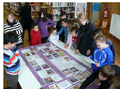
Des après-midi contées sont prévues pour les enfants.