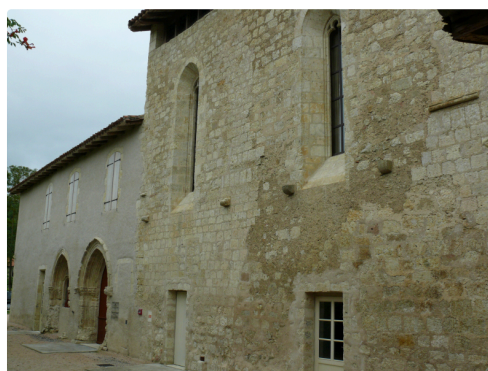
La médiathèque est située à la Maison de la Culture.