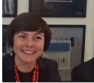
Quel sera le nouveau nom de notre région ?

Bientôt une "Consultation Citoyenne" promise par Carole Delga sur le nom de la région