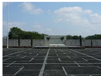
Esplanade commémorative de la bataille de Camerone à Camarón de Tejada.