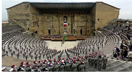
Commémoration de la bataille de Camerone par le 1 er REC au théâtre antique d'Orange en 2010.