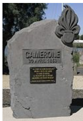
Monument aux morts à Agde , commémoratif de la bataille de Camerone

En bande dessinée, Jean-Pierre Gourmelen et Antonio Hernández Palacios ont publié Mac Coy tome 11 : Camerone chez Dargaud (1983). Philippe Glogowski et Marien Puisaye ont, quant à eux, publié une bande dessinée en 4 tomes sur l'histoire de la Légion étrangère dont le 1 er tome s'intitule "La Légion. : 1 : Camerone : histoire de La Légion étrangère, 1831-1918" (Ed. Triomphe ).