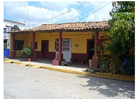
La hacienda où s'est déroulée la bataille.