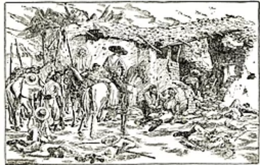
Relève des blessés par les soldats mexicains.