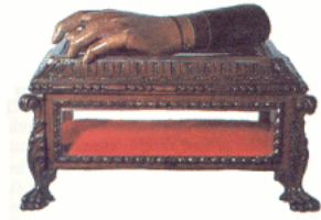
La main du capitaine Danjou.