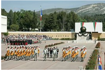
Commémoration de la bataille de Camerone en 2006 à Aubagne.

Aujourd'hui, la main du capitaine Danjou est conservée dans la crypte du musée de la Légion étrangère à Aubagne .