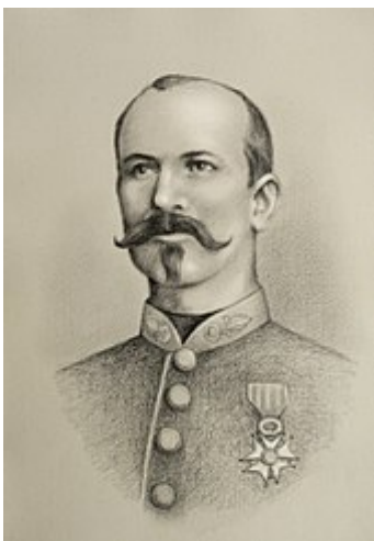
Le capitaine Jean Danjou .

Partie de Chiquihuite vers 1 h du matin, la compagnie passe devant le poste de Paso del Macho (Le Pas du mulet ), commandé par le capitaine Félix Gustave Saussier 2 et poursuit sa route. Après avoir dépassé le groupe de maisons appelé Camarón de Tejada (55 km à l'ouest de Veracruz ), elle arrive à Palo Verde vers 7 h du matin, après avoir parcouru à marche forcée les vingt-quatre kilomètres qui la séparent de sa garnison de départ. Les légionnaires s'arrêtent pour faire le café.