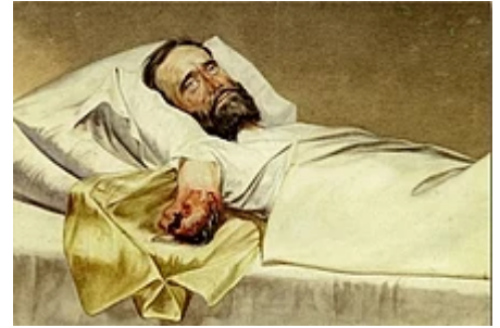
Un blessé par une balle Minié : amputation et gangrène.

Depuis, chaque 30 avril, les héros de ce combat sont honorés dans tous les régiments et par toutes