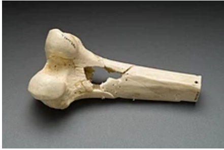
Fémur touché par une balle Minié reconstitué.

La moitié de la compagnie fut tuée ou mortellement blessée. Les blessés furent transportés aux hôpitaux de Huatusco (en) et de Jalapa où ils furent soignés. Les prisonniers furent ensuite échangés contre des prisonniers mexicains. Le premier échange eut lieu trois mois plus tard et permit à huit légionnaires d'être échangés contre deux cents Mexicains 7 .