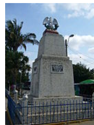
Obélisque mémorial aux soldats mexicains en mémoire de la bataille de Camerone.