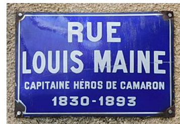
Plaque de rue dans le centre-ville de Mussidan .